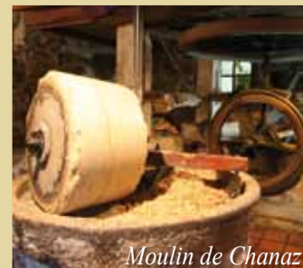
Moulin de Chanaz