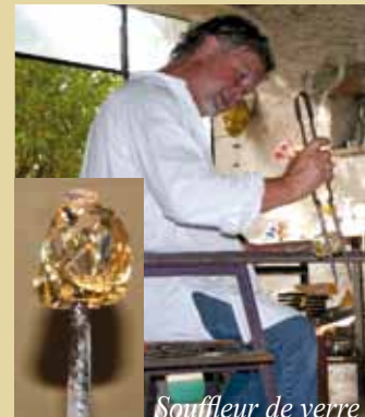
Souffleur de verre