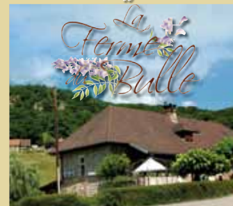
Restaurant - Tél. 04 79 54 57 45 www.lafermedubulle.com

Toutes nos croisières se font au départ de notre embarcadère, au bout du village.